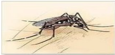
Nyamuk Aedes Aegypti cikgutanc1.blogspot.com (2011)

Virus ini akan terpendam dalam badan pesakit selama 3-14 hari sebelum menunjukkan tandanya.